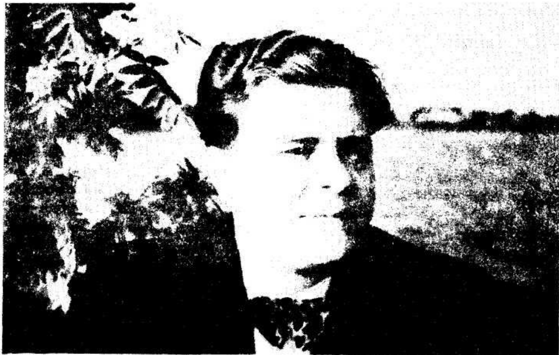
После концерта 25.04.51г. Финляндия, г.Куопио

После завтрака пошли походить по магазинам. Хотел Ленке купить шапочку, но все это очень дорого здесь. Времени еще есть, посмотрим, что будет дальше. Все хотят, чтобы я купил себе пальто, но это на меня стоит очень дорого. А вот Борьке нужно будет купить. В этом городе всего полно, но почем-то все значительно дороже. Сережа Архипов купил себе хорошее пальто за 60 марок.