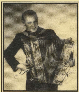
ВЕСТЕРИНЕН Вильо (1907-1961)