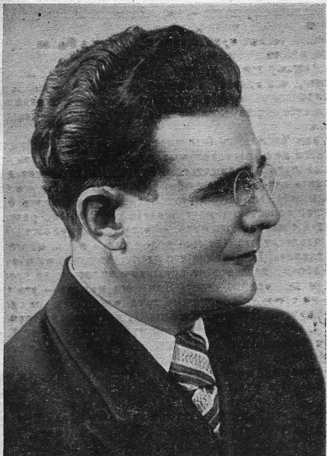
И. Я. Паницкий, заслуженный артист РСФСР.