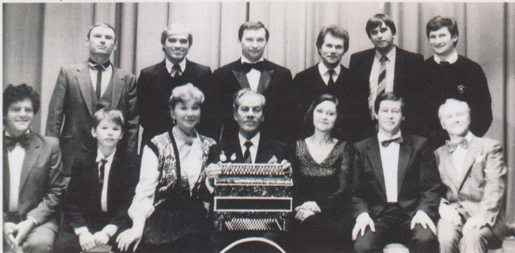
70-и летие, участники юбилейного концерта