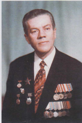
Ветеран войны и труда