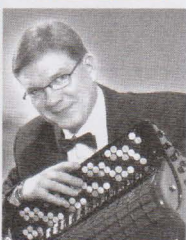
NORDSTRØMMEN og VELFJORD TREKKSPILKLUBB