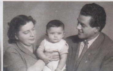
В кругу семьи